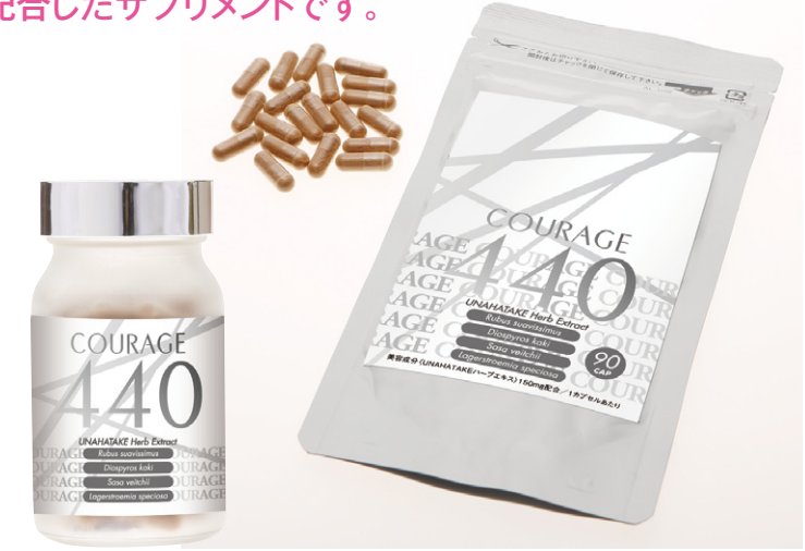
◎クラージュ440(ボトル) 90カプセル 8,900円(税別) ◎クラージュ 440(袋) 90カプセル 8,900円(税別)

UNAHATAKEハーブエキスの機能性やRCT(ランダム化比較試験)情報は以下で検索